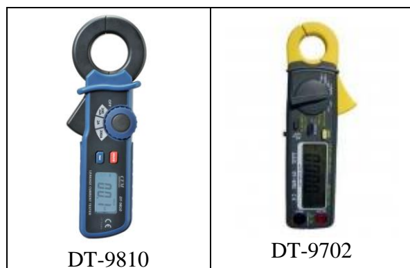
Рисунок 1. Фотографии общего вида клещей серии DT