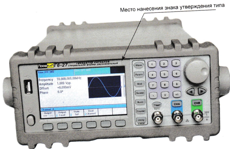
Рисунок 1 – Общий вид средства измерений

Общий вид средства измерений, на котором указано место нанесения знака утверждения типа, представлен на рисунке 1.