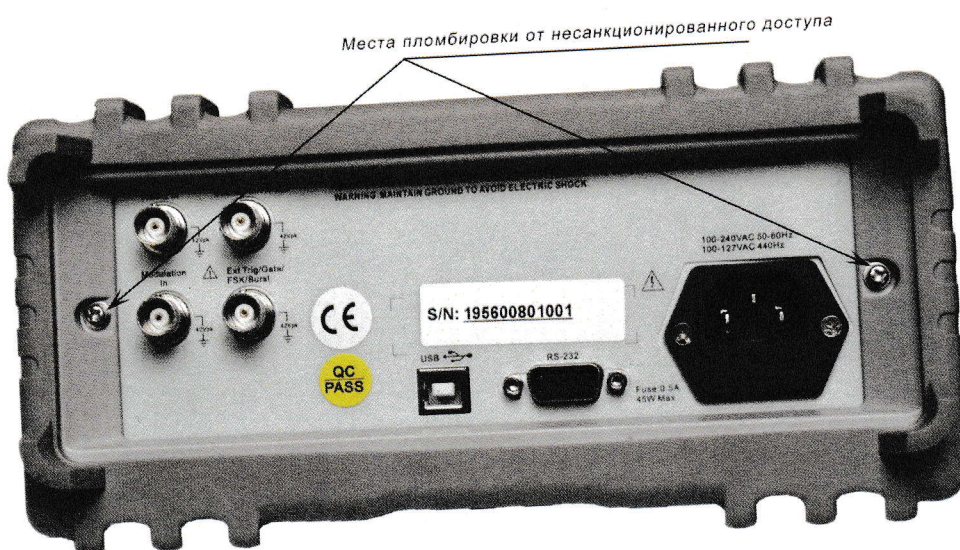
Рисунок 2 – Схема пломбировки от несанкционированного доступа и место нанесения серийного номера, идентифицирующего каждый экземпляр СИ